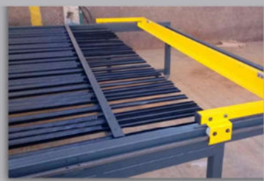
Alimentador longitudinal para 3 e 6 metros.

A MMES fabrica telas nos espaçamentos 10, 15, 20 e 30 até o fio 5mm. Equipamento conta com o sistema de deslocamento automático que permite a fabricação de todos os modelos de telas, sem a necessidade de ajustes mecânicos.